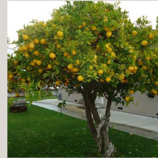
Citrus x limon