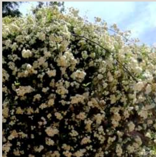
Rosa (Rosal trepador blanco)