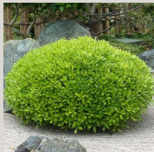
Pittosporum tobira 'nana'